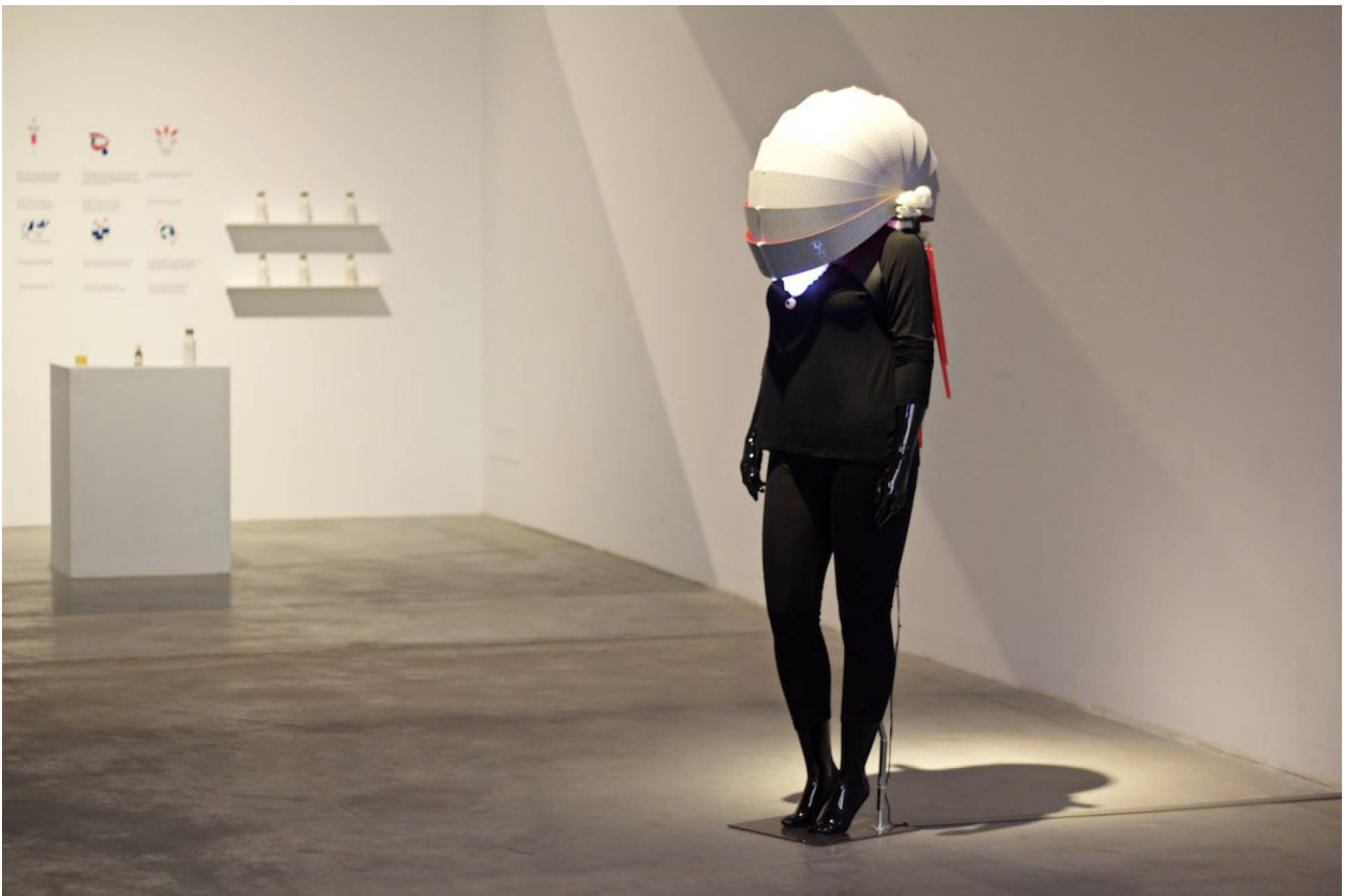
'Environmet Dress'. uno de los proyectos que se pueden ver en Laboral (Gijón).

Si ante la última revolución tecnológica somos “primitivos de una era desconocida”, como escribió McLuhan, Next Things. Next Starts , los cinco proyectos de investigación que se muestran ahora en Laboral Centro de Arte de Gijón , constituyen un intento de ir en lo digital, del mito al logos. Mapocci es un peluche que trata de explorar las posibilidades afectivas del Internet de las cosas y emular procesos como los de las neuronas reflejo; Flone intenta democratizar los drones y hackear el espacio aéreo; el Slow Internet Café manipula y altera la navegación en la red; Environment Dress es un “wearable” que mide las constantes de las circunstancias externas y no las del yo; y Thero es un objeto artístico que esconde un router capaz de funcionar como una seguridad privada de la intimidad digital.