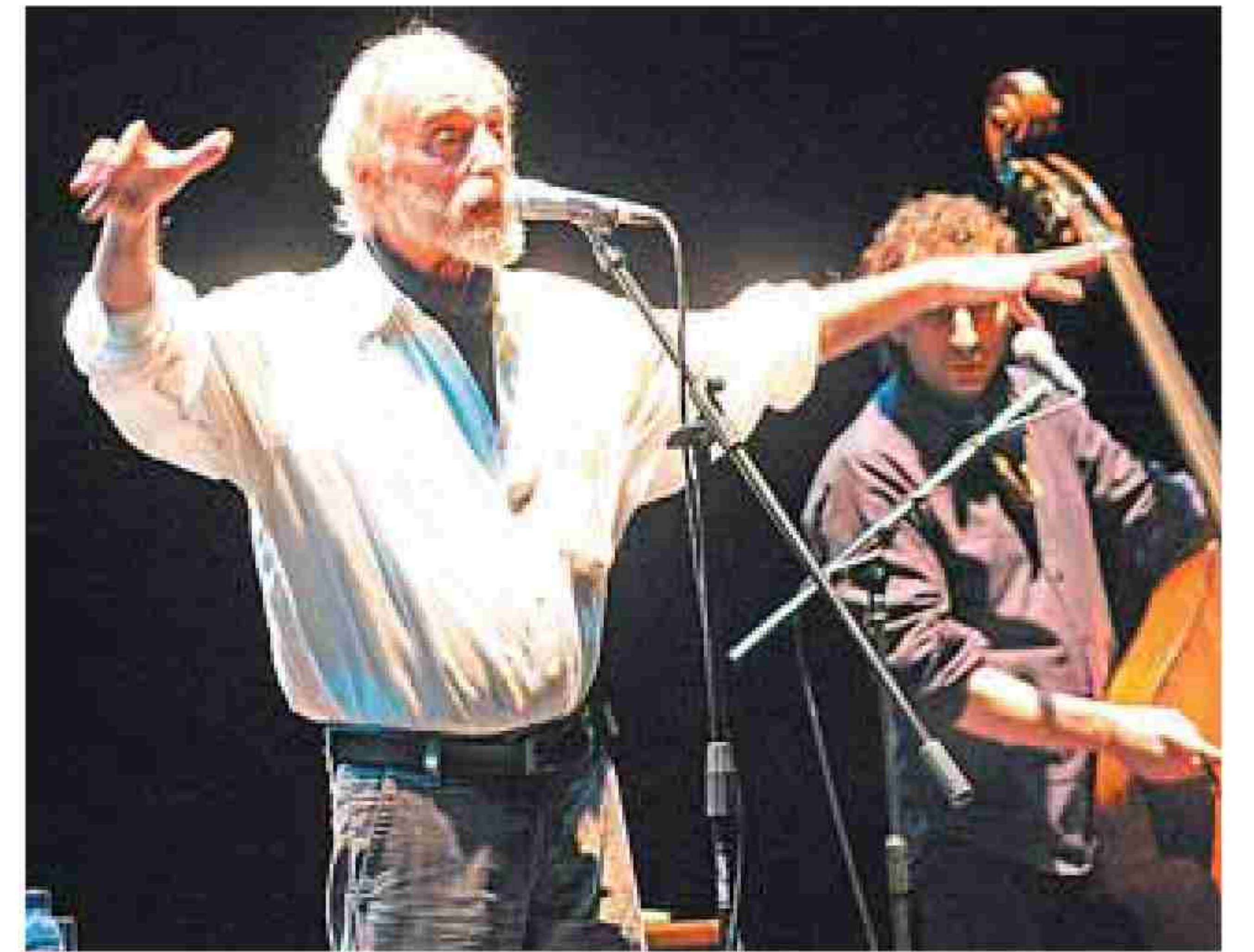
Javier Krahe en un concierto de Gijón.