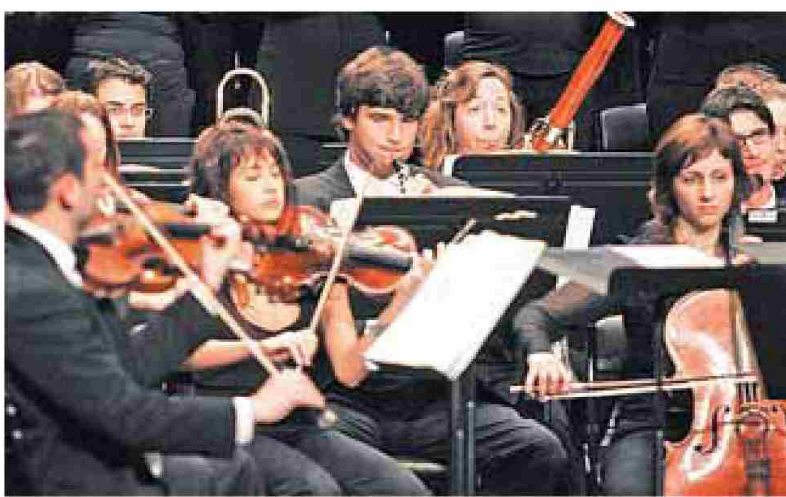
La Orquesta Sinfónica de Gijón, durante una actuación.